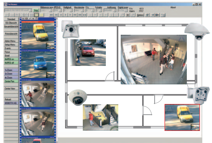
Alarm-Management MxControlCenter Software: liegt jeder Kamera kostenfrei bei, keine Kamerabeschränkung, Layout-Editor, Recherche

MOBOTIX-Kameras sind ohne Heizung beschlagfrei und benötigen nur 3 Watt, so dass sie ganzjährig über das Netzwerk-Datenkabel gemäß PoE-Standard versorgt werden können. Dies reduziert die Leitungsverlegung wie auch die Notstromversorgung drastisch.