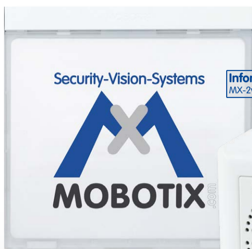
Infomodul Mx2wire+ MX-2wirePlus-Info1-EXT