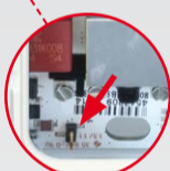
LED illumination activated