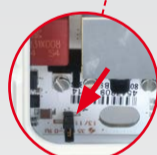
LED illumination deactivated