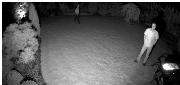
S/W-Sensor mit IR-Strahler