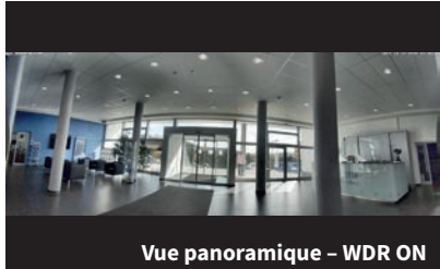
Vue panoramique - WDR ON