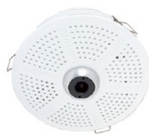
c26 with lens B036