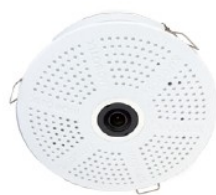
c26 with lens B016