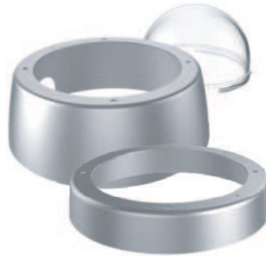
Vandalism Set (Standard/XL)