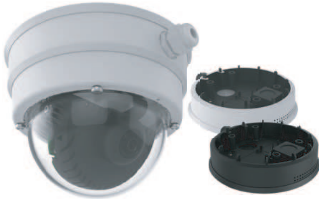
On-Wall Set with Audio (white/black)