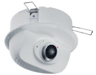
Vollständige p26B- Nachtkamera