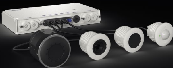
MOBOTIX S74/S74 termográfica Cuatro módulos flexibles en una sola cámara