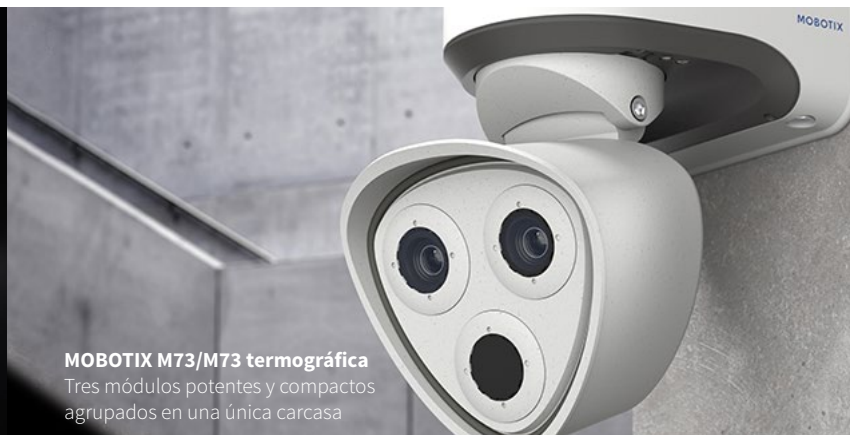
MOBOTIX M73/M73 termográfica Tres módulos potentes y compactos agrupados en una única carcasa