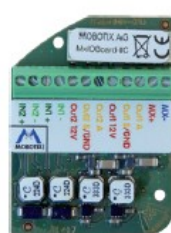
MxIOBoard-IC for signal input/output (accessories)