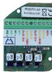
MxIOBoard-IC for signal input/output (accessories)