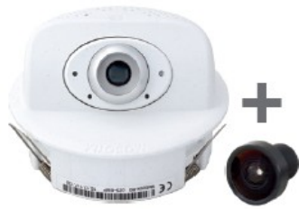
p26 camera body und lenses B036 to B237 for self-mounting