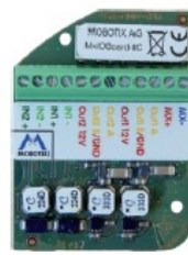
MxIOBoard-IC for signal input/output (accessories)