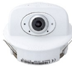
p26 camera, lens B016-B237