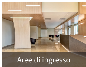
Aree di ingresso