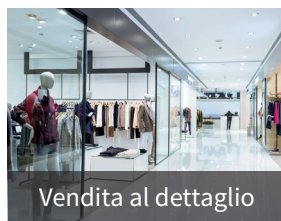
Vendita al dettaglio