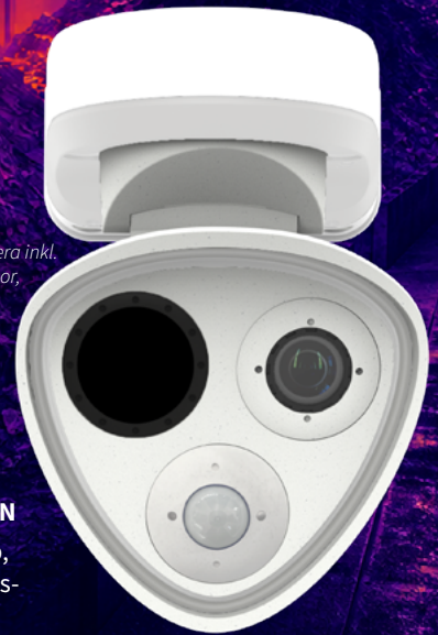
M73 High-End-Kamera inkl. 95°-VGA-Wärmesensor, 4K-Bildsensor & MultiSense