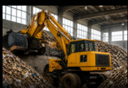
Abfall- & Recyclingwirtschaft