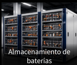
Almacenamiento de baterías