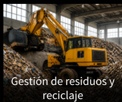
Gestión de residuos y reciclaje