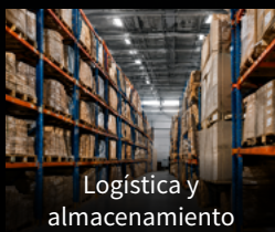
Logística y almacenamiento