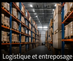
Logistique et entreposage