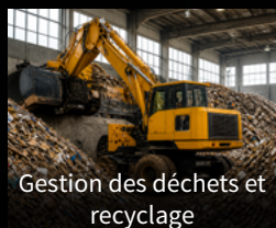
Gestion des déchets et recyclage