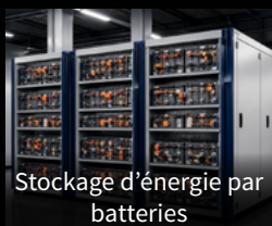
Stockage d'énergie par batteries