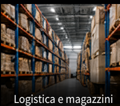
Logistica e magazzini

LA RILEVAZIONE DEGLI INCENDI È ESSENZIALE. LA RILEVAZIONE PRECOCE PREVIENE L'ESCALATION.