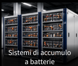
Sistemi di accumulo a batterie