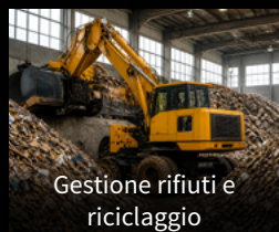
Gestione rifiuti e riciclaggio